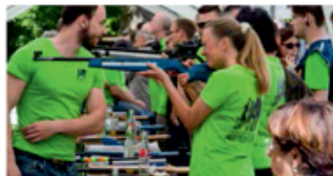
Großer Andrang der Läufer am Schießstand beim AbteIRace 2016

Sämtliche Angebote am 15. Mai 2016 werden aktiv begleitet von Mitgliedern der Freiwilligen Feuerwehr Wadgassen und des DRK Wadgassen.