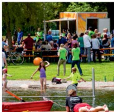
Buntes Treiben für Familien, Jung und Alt beim 1. Wadgasser ABTEIRACE 2016 im Wadgasser Parkbad. Im Bildhintergrund der Anmelde- und Messwagen der Meisterchip-Laufprofis.

Zeitgleich mit der Eröffnung der Saison 2016 im Parkbad Wadgassen geht am 15. Mai 2016 die kombinierte Lauf- und Schießveranstaltung in die zweite Runde. Nach dem großen Erfolg dieses im vergangenen Jahr neu ins Leben gerufenen Breitensportangebotes, das die Gemeinde Wadgassen gemeinsam mit dem Bäderbetrieb veranstaltet, rechnen wir in diesem Jahr mit einer deutlichen Steigerung des Laufinteresses und zugleich der Besucherzahlen.